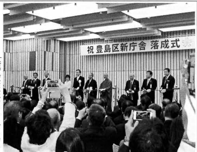
▶新庁舎落成式でのテープカット